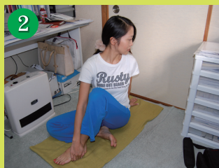
2. 右手で左足裏をつかみ、左手は後ろにつきます。