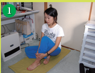
1. 左膝を曲げ、背中が丸くならないように、姿勢を整えましょう。

椅子に座りながらも問題ないので、1日5分だけ毎日続けてみて下さい。3日目にはきっと効果を感じられるはずです。