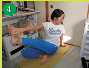
4. さらに息を吐きながら、顔を左側にねじりましょう。この時、両肩が平行に回るようなイメージでねじりを深めていきましょう。そのまま、5呼吸続けましょう。反対側も同様に。