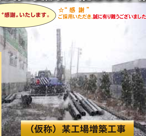
(仮称) 某工場増築工事

◎ e-pile工法の最大の特徴となる杭先端の菱形孔と切削刃とが抜群の掘削性能を発揮し、スムーズに所定の設計深度まで貫入させる事ができました。また、準備工では搬入路及び施工地盤の安全確保から砕石敷き等を元請け様にご協力いただき安全に工事を完了することが出来ました。