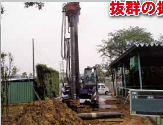
ボーリング柱状図